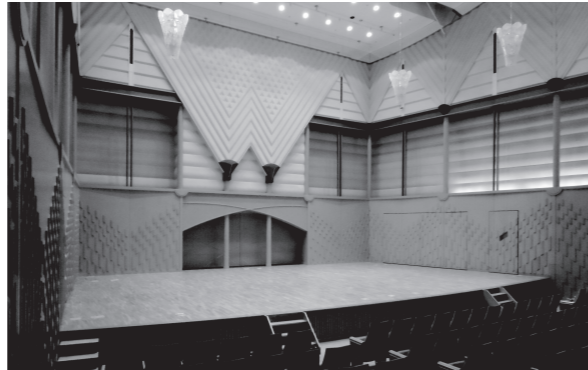
ワンボックス型・室内楽専用ホール 客席数457席 (車いす席3席)